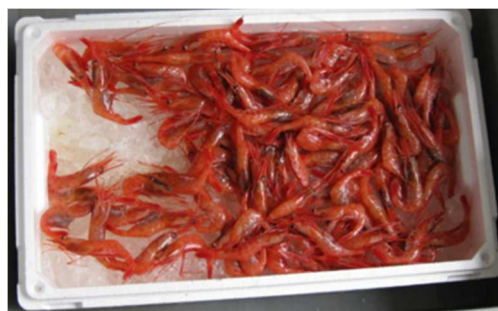
図2 ホッコクアカエビ

平成31年2月27日に沖合底曳網漁船により網代漁港へ水揚げされたホッコクアカエビを使用した（図2）。試験に供するまで下氷に保存した。①で調整した各試験区に30分浸漬し、エビは各試験区水とともにトレーへ移し包装後、5℃の冷蔵庫で3日間保存した。