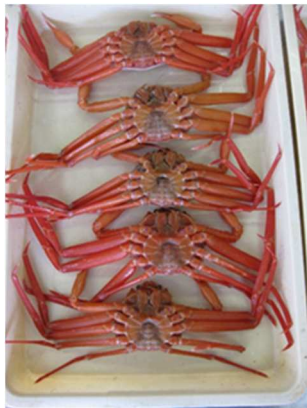
図4 ベニズワイガニ

平成31年3月12日に境漁港へ水揚げされたベニズワイガニを使用した(図4)。漁獲から水揚げまで約2日経過していた。各試験区5尾使用し、①で調整した各試験区に30分浸漬し(図5)、取り出し後、余分な水分をふき取ったのち、トレーにおおむけに並べ、包装したのち5℃の冷蔵庫にて3日間保管した。