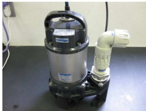
図1 ファインバブル生成装置（高さ374mm、重量7.5kg）

ウルトラファインバブル生成装置（株）ナノクス社、XNP25A-040）を貸借し（図1）、メーカーが推奨する方法にて、酸素ファインバブル水を調整した。調整方法は100L容量のアクリル水槽に冷2%食塩水を作製し、ファインバブル生成装置を水槽内に入れた。酸素流量1L/min（3.0nL/min）で装置を稼働し、溶存酸素量（DO）30mg/L以上となるように調整した。また、酸素の代わりに空気を封入した対照区、酸素流量を同一のままファインバブル生成装置の代わりに市販のエアストーンを接続したエアレーション区の計3区で比較試験を行った。