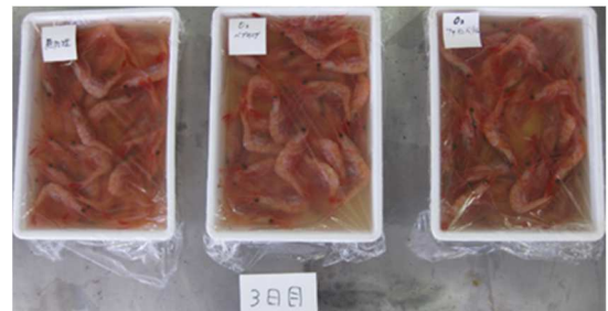
図6 漬け込みによるホッコクアカエビの状況

各試験区とも黒変は見られず、エビのドリップの流出により漬け込み水が濁っていた。ファインバブルによる黒変防止効果は確認できなかった(図6)。