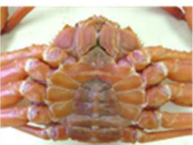
図8 各処理を行ったベニズワイガニの冷蔵保管における黒変の状況